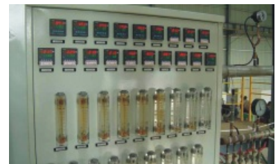
水冷系统 Cooling Water Unit